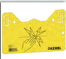
TABELLA DI AVVISO PER RECINTI ELETTRICI

In poliammide rinforzato con fibra di vetro. Possibilità di allentare facilmente la banda o il filo. Adatto per filo fino a Ø 8 mm e banda fino a h 40 mm.