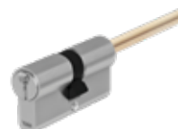
Doppio cilindro predisposto pomolo