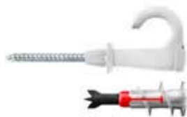
EasyHook occhio aperto DuoBlade