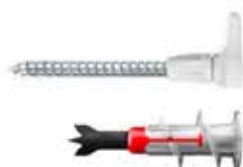
EasyHook gancio DuoBlade