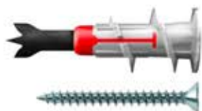
Tassello per cartongesso DUOBLADE S con vite testa svasata piana