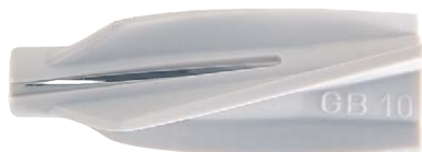
Fissaggio per calcestruzzo cellulare GB