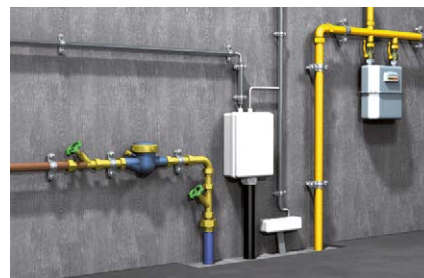
Fissaggio delle condotte