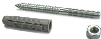
Kit vite doppia filettatura