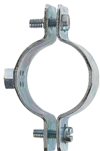
Collare per tubi CPT-M