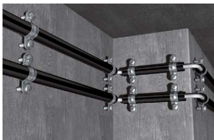
Fissaggio delle condotte in acciaio