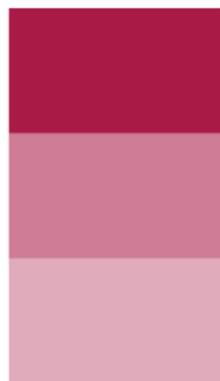
216 Rosso Amaranto