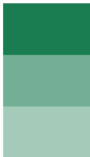
215 Verde Medio