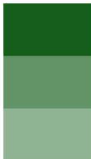
206 Verde Chiaro